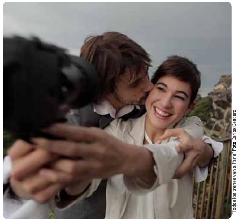
"Todos los trenes van a París"