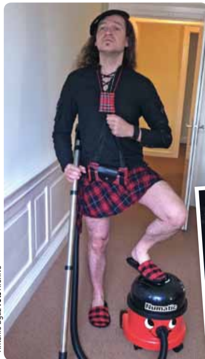
Antonio Dyaz Foto Archivo