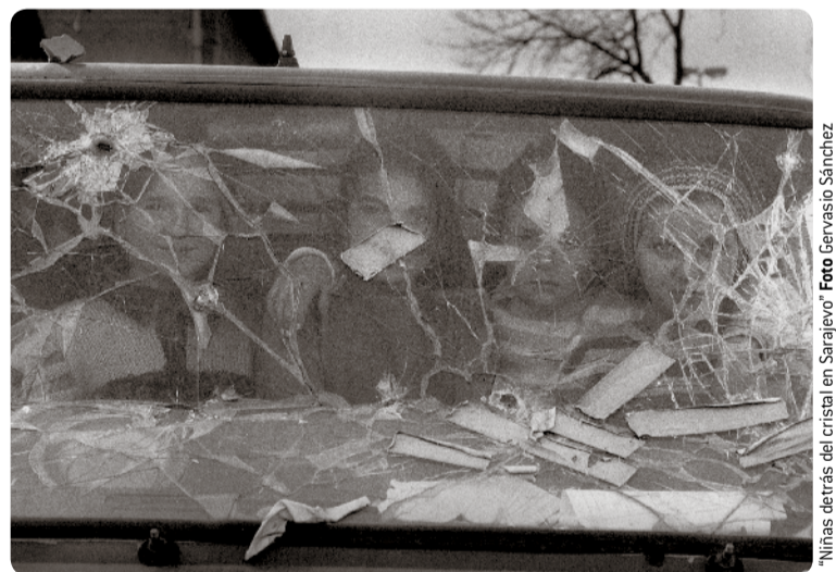
"Niñas detrás del cristal en Sarajevo"